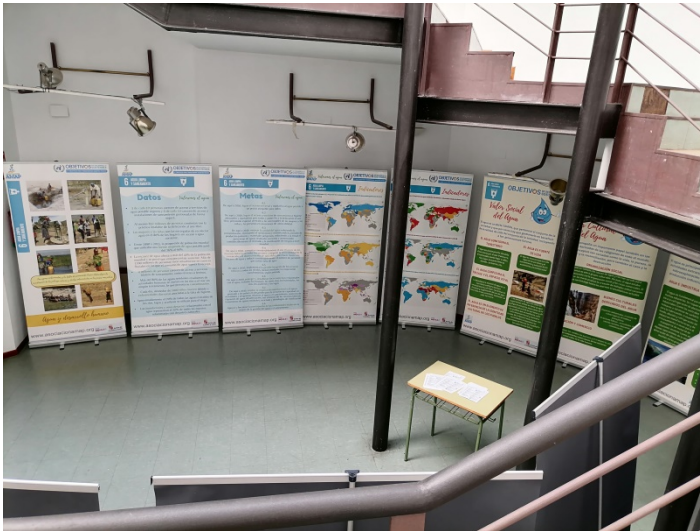
Conferencia "Agua y salud" el 28 de septiembre de 2023 en el Centro Cívico Santa Bárbara